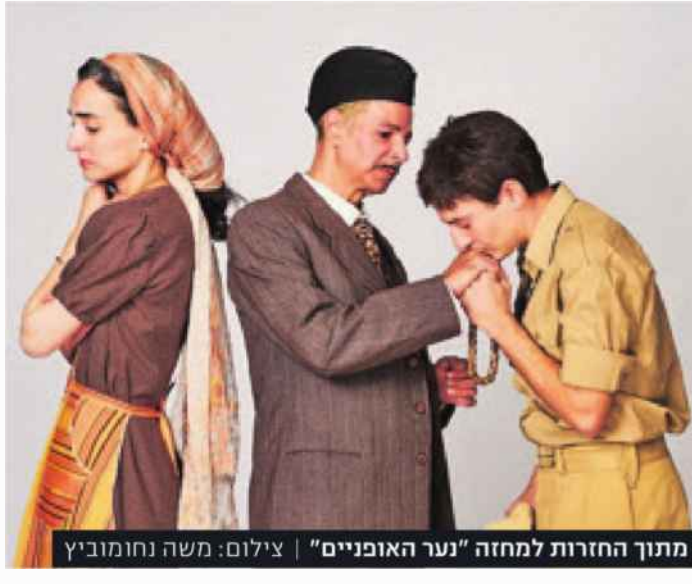
מתוך החזרות למחזה 'נער האופניים'

ולגרות את מיצי החושים באוכל, באהבה, בזעם, בריחות - וזה אף פעם לא על חשבון העלילה, שכל הזמן דוהרת קדימה".